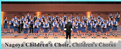
Nagoya Children's Choir, Children's Chorus