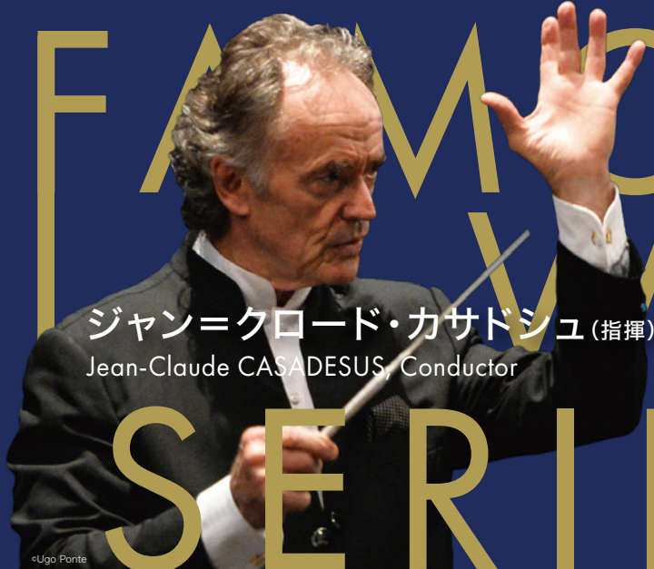
ジャン＝クロード・カサドシュ (指揮) Jean-Claude CASADESUS, Conductor