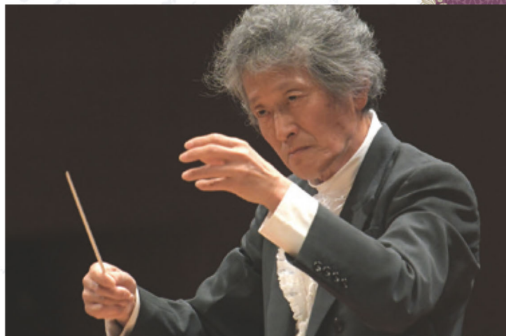
小泉和裕(指揮/名フィル音楽監督) Kazuhiro KOIZUMI, Conductor / Music Director