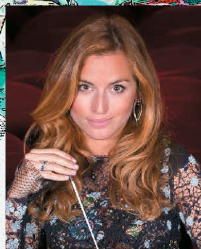
ベアトリーチェ・ヴェネツィ (指揮)