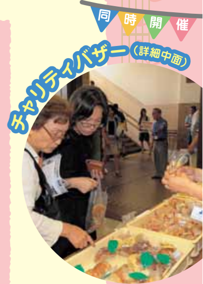
同時開催 チャリティバザー (詳細中画)