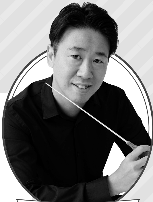
川瀬 賢太郎 (指揮/名フィル音楽監督)

現在、オーケストラ・アンサンブル金沢パーマネント・コンダクター、札幌交響楽団正指揮者、三重県いなべ市親善大使。2015年渡邊暁雄音楽基金音楽賞、2016年第14回齋藤秀雄メモリアル基金賞、第26回出光音楽賞などを受賞。東京音楽大学作曲指揮専攻(指揮)特任講師。