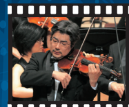
ヴァイオリン独奏・後藤龍伸* Tatsunobu GOTO, Solo Violin