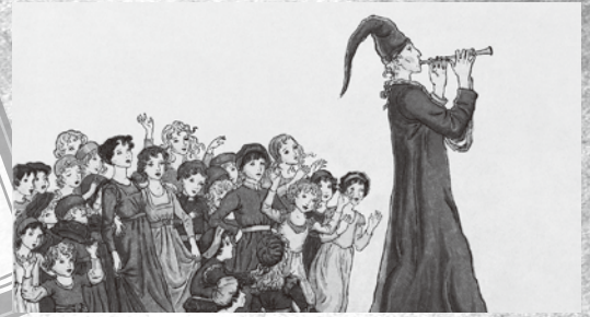
『ハーメルンの笛吹き』 (ケイト・グリーナウェイ、1910年フレデリック・ワーン社刊 ロバート・ブラウニング著『ハーメルンの笛吹き』挿絵)

アメリカ現代の作曲家ジョン・コリリアーノは、偉大なるフルート奏者サー・ジェームズ・ゴールウェイから協奏曲を依頼されます。ただの協奏曲では面白くない！と考案・作曲したのが、ドイツの都市ハーメルンの有名な伝説に基づいた『ハーメルンの笛吹き』幻想曲です。奇抜な服装のソリストはフルートを持替え、笛や太鼓をもって登場する子どもたち…。演劇的な要素が取り入れられ、初演以来、演奏のたびにソリストや楽団によって演出が変えられています。今後も変化し、成長し続けるだろうと作曲家自身が語る作品、名フィル・バージョンがどうなるか、必見です。