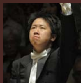
Kentaro KAWASE, Conductor [指揮/名フィル指揮者] 川瀬 賢太郎

2012 5/18 金 6:45pm • 5/19 土 4:00pm 6:45pm, Friday May 18 / 4:00pm, Saturday May 19, 2012