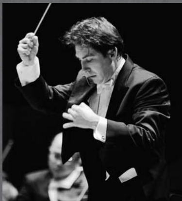
ロッセン・ゲルゴフ