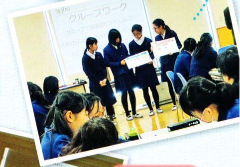
市民団体による 活動紹介