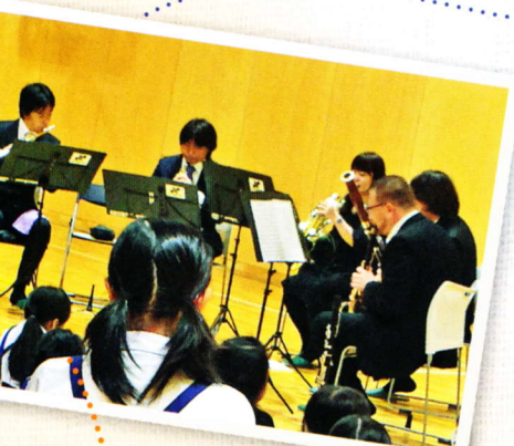
名フィルによる アウトリーチ