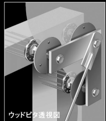
ウッドピタ透視図