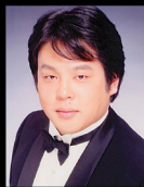
【テノール】 望月哲也 TENOR: TETSUYA MOCHIZUKI