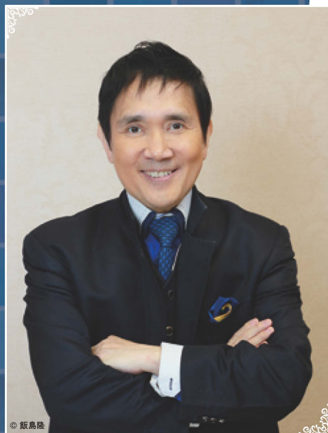
大植英次(指揮) OUE Eiji, Conductor