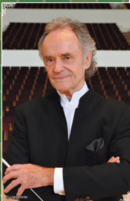
ジャン＝クロード・カサドシュ(指揮) Jean-Claude CASADESUS, Conductor

2021.4-2022.3 Season "Speciality" Series