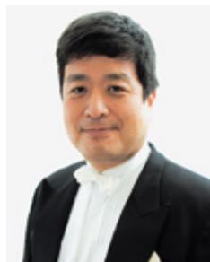
日比 浩一 Koichi HIBI

東京藝術大学音楽学部附属音楽高等学校を経て、ジュリアード音楽院より学士号取得。2000年カール・ニールセン国際音楽コンクール(デンマーク)ヴァイオリン部門優勝。2004年5月～2014年3月広島響コンサートマスター。2012年4月名フィルのコンサートマスターに就任し、同年9月より大阪フィル特別客演コンサートマスター、2014年4月からは同団首席コンサートマスターを兼務する。京都市立京都堀川音楽高等学校非常勤講師。