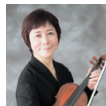
井上 絹代 Kinuyo INOUE