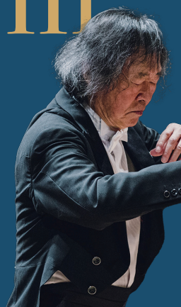
小林研一郎(名フィル桂冠指揮者) KOBAYASHI Ken-ichiro, Conductor / Conductor Laureate

III 2026. 11/19(木) 18:45 開演 1回券発売日 7/27(月) スペシャル・クワトロ III コバケン・スペシャル